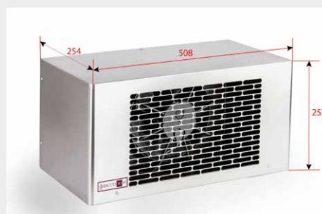
Unità interna: vista posteriore